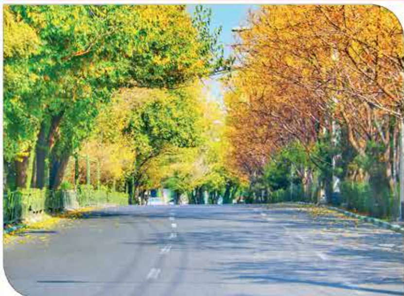
بلوار گلستانه (مصمص فرهنگ)