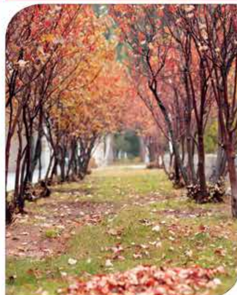
بوستان بنفشه (زهرا حسن‌زاده)